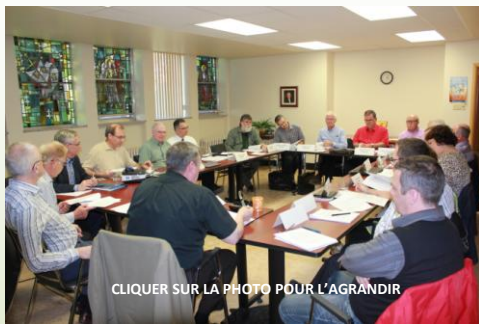
Économistes diocésains en réunion à Nicolet

Cette année, le sommet du « J-20 » (un seul Jésus, 20 diocèses) a réuni les économistes des diocèses catholiques du Québec à l'évêché de Nicolet les 28, 29 et 30 mai 2014.