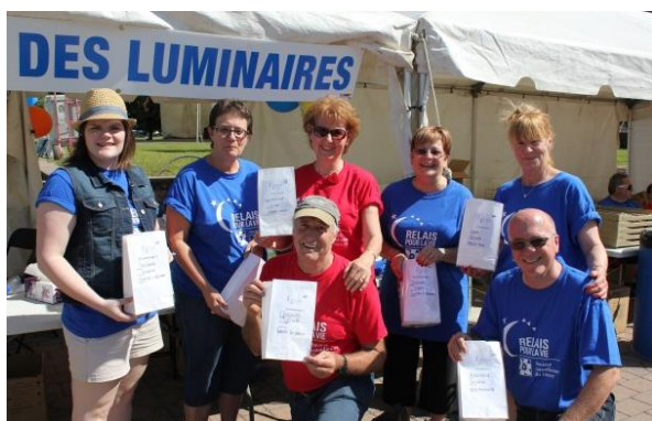
Bénévoles du kiosque des luminaires pris « le sac dans la main »

Portons dans notre prière Bout de chou, sa maman, toutes les personnes atteintes du cancer et leurs aidants. C'est là le plus grand service que nous pouvons leur rendre. Et passer l'espérance, nous commençons à être bons là-dedans!