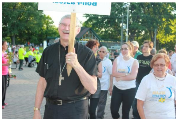
Ensemble, on peut vaincre le cancer!

Son tour venu, la maman demande gentiment, non sans émotions dans la voix, si son fils de 5 ans peut écrire lui-même son nom sur le luminaire qu'elle vient d'acheter. Il a le cancer. Bout de chou et cancer : des mots qui ne vont tellement pas ensemble. Ainsi réunis, ils écorchent les oreilles et fendent le cœur. Pendant que l'enfant écrivait son nom la langue sortie, les gorges se nouaient et les yeux se mouillaient.